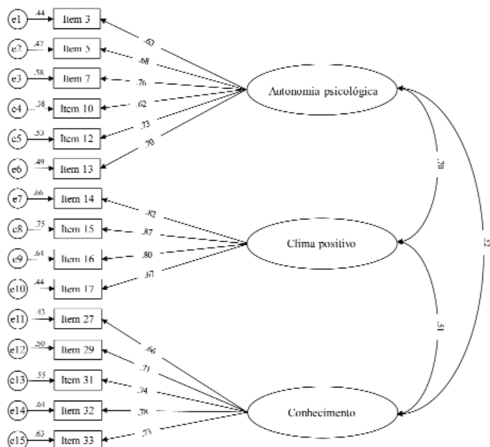
Figura 2. Peso fatorial estandarizado e variância do erro na estrutura fatorial tridimensional da escala de estilos educativos da mãe

Nota. Índices de ajustamento: \chi^2(87)=271.97 , p<.001 , \chi^2/g.l.=3.13 , GFI=.95 , CFI=.96 , TLI=.95 , PCFI=.80 , PGFI=.69 , RMSEA=.06 , p=.07 , 90% IC [.05,.06].